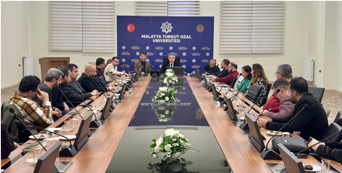
Şekil 2. Akademik Birim Danışma Kurul Toplantısı