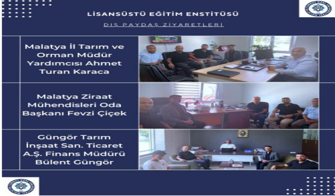
Şekil 1. Dış Paydaş Değerlendirme Toplantısı